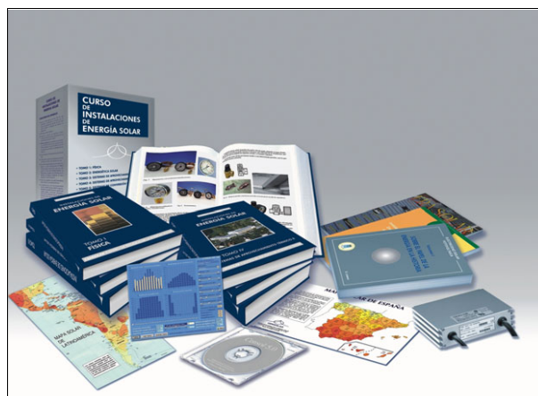
Material del curso de Projectista Instalador.

Folleto informativo en www.fotovoltaica.com/folpvsun.pdf